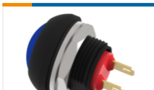
TE 系列/零件编号1-2329360-0 PB OFF/ON RC BLU M2 TERM. IP68