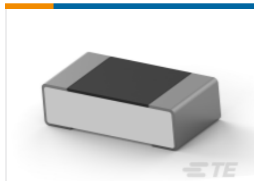
TE 系列/零件编号7-2176369-4 RQ 0603 232R 0.1% 10PPM 5K RL