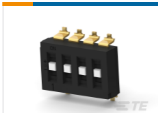
TE 系列/零件编号2-2319747-1 TRI-STATE DIP 4P G RECESS T&R