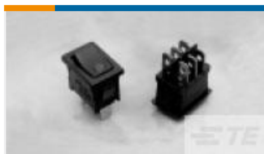
TE 系列/零件编号1571091-3 PRBSA1-16F- BB0CW=POWER ROCKER