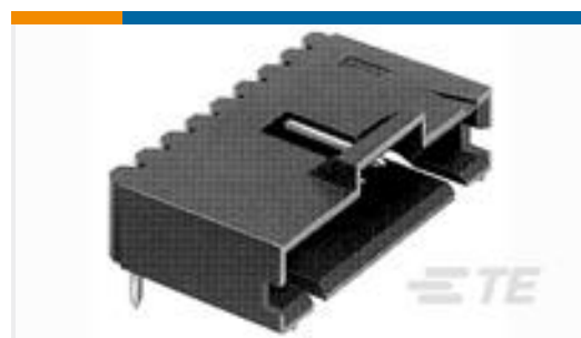
TE 系列/零件编号1-103635-0 11 MTE HDR SRRA LATCH .100CL