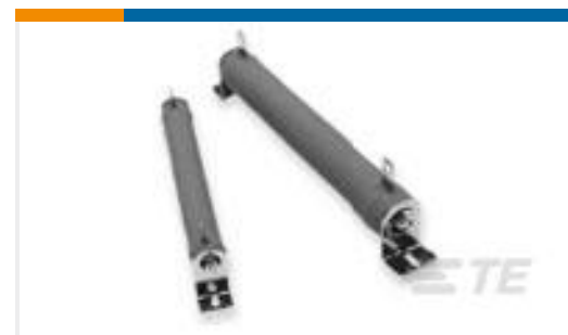
TE 系列/零件编号1879457-3 TE 2500W 1R5 5% Bracket