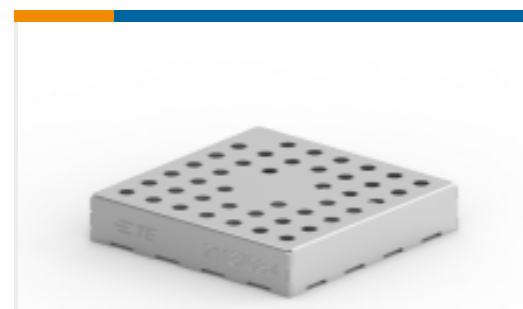
TE 系列/零件编号2118708-4 1 PC STD SHIELD, AL-26.21 X26.21X5.08MM