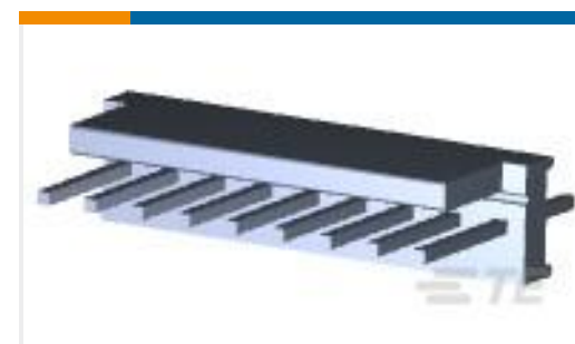
TE 系列/零件编号3-641213-9 09P MTA100 HDR ASSY PO/ST LF