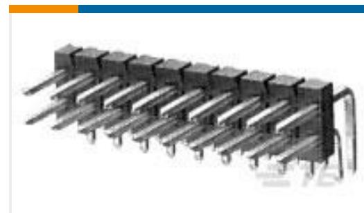
TE 系列/零件编号5-103326-2 04 MODII HDR DRRA B/A . 100CL