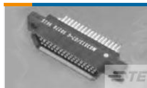
TE 系列/零件编号8-1532020-0 095-0604-2030=MCDR3-B-9SS