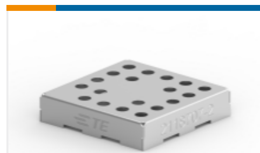
TE 系列/零件编号2118707-2 1 PC STD SHIELD, CRS- 16.50X16.50X3.60MM