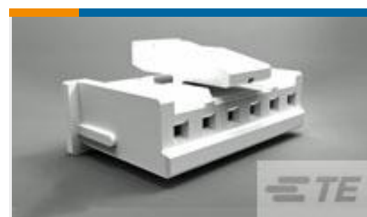
TE 系列/零件编号1- 1969442-6 EP 2.5 TPA Housing, 16 Pos