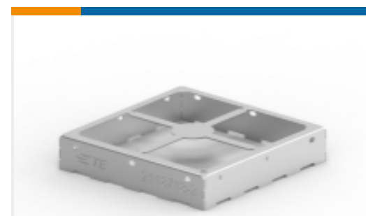
TE 系列/零件编号2118718-2 STD SHIELD FRAME, CRS- 26.21X26.21X5.08MM