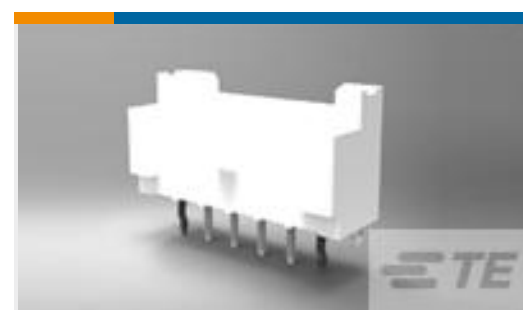
TE 系列/零件编号1- 2132230-6 EP2.5 Shrouded HDR ASSY 16P VE