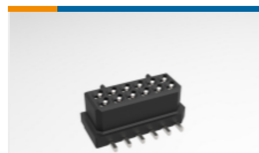
TE 系列/零件编号4-174639- 4 1.25FP,R14,DL,B,N,BG