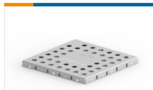
TE 系列/零件编号2118717-2 STD SHIELD COVER, CRS- 26.71X26.71X2.00MM