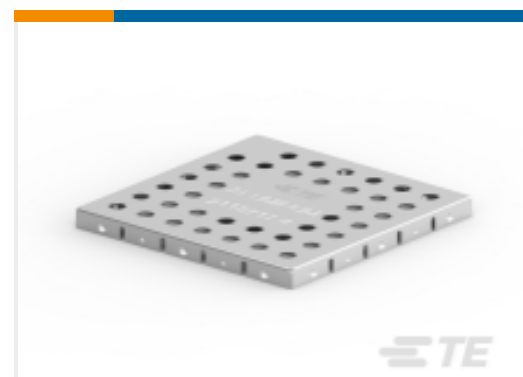
TE 系列/零件编号 2118717-4 STD SHIELD COVER, AL-26.71X26.71X2.00MM