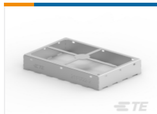
TE 系列/零件编号2118722-2 STD SHIELD FRAME, CRS-38.10X25.40X6.00MM