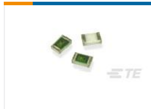
TE 系列/零件编号9-1625867-0 RP 1J 0.166W 53R6 0.1% 25PPM 1K RL