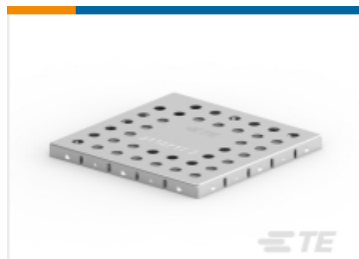
TE 系列/零件编号2118717-2 STD SHIELD COVER, CRS-26.71X26.71X2.00MM