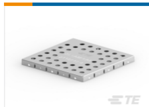
TE 系列/零件编号2118717-4 STD SHIELD COVER, AL-26.71X26.71X2.00MM