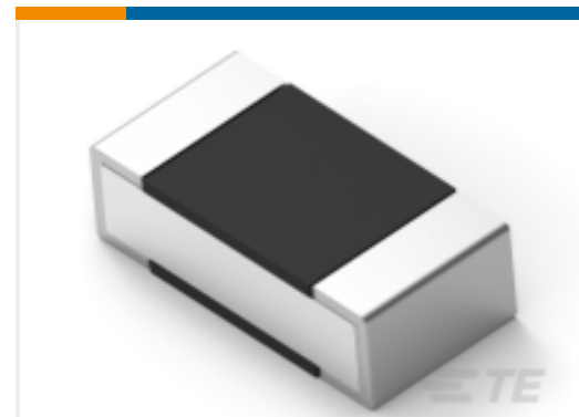
TE 系列/零件编号5-2176304-6 RP 1E 0.1W 37R4 0.1% 25PPM 5K RL