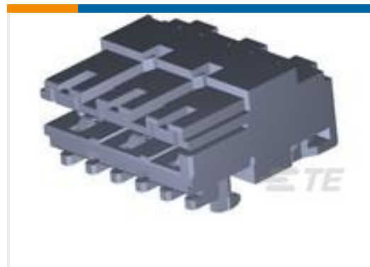
TE 系列/零件编号8-1740533-3 AMP DUOPLUG POW CONNECTOR