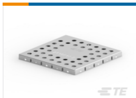
TE 系列/零件编号 2118717-2 STD SHIELD COVER, CRS-26.71X26.71X2.00MM