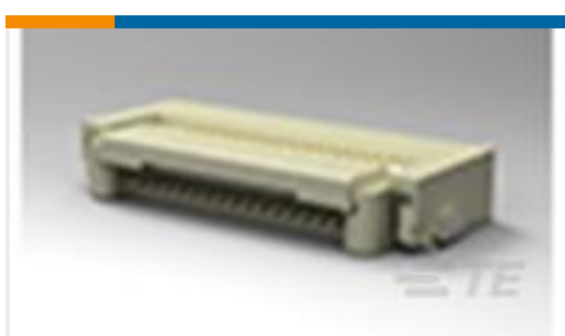
TE 系列/零件编号1775333-6 ZIF FPC 0.5, 2H, 6P