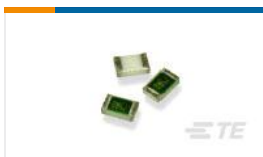
TE 系列/零件编号8- 1614882-6 CPF 0603 6R2 0.1% 25PPM 1K RL