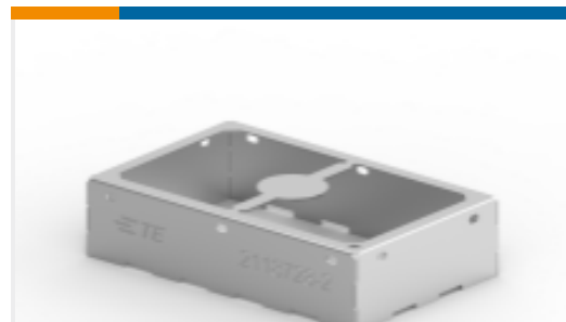
TE 系列/零件编号2118728-2 STD SHIELD FRAME, CRS-29.36X18.50X7.00MM