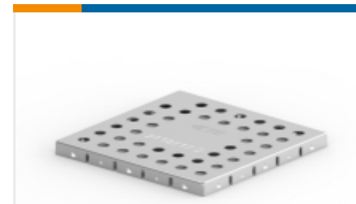
TE 系列/零件编号2118717-2 STD SHIELD COVER, CRS-26.71X26.71X2.00MM