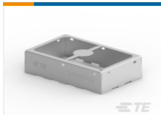
TE 系列/零件编号 2118728-2 STD SHIELD FRAME, CRS-29.36X18.50X7.00MM