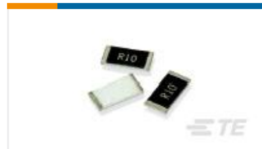
TE 系列/零件编号2176056-4 RLP73V 2B R013 5% 5K RL