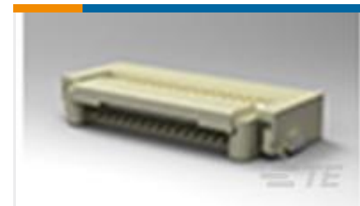
TE 系列/零件编号3-1775333-2 ZIF FPC 0.5, 2H, 32P