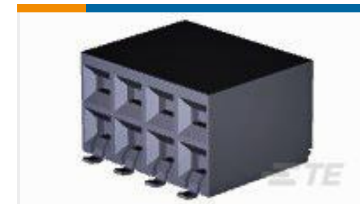
TE 系列/零件编号5147722-3 08 MODII HORZ DR SFMNT 30AU