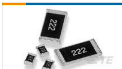
TE 系列/零件编号2-2176185-2 CRGH0805 1% 39K 0.33W