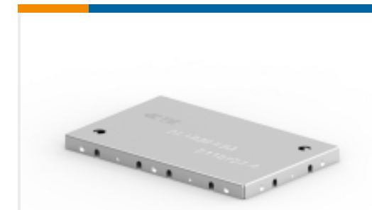
TE 系列/零件编号2118727-4 STD SHIELD COVER, AL-29.96X19.10X2.00MM