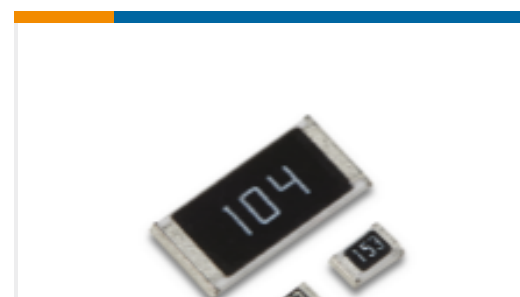
TE 系列/零件编号4-2176345-1 CRGCO 1210 22K 1%