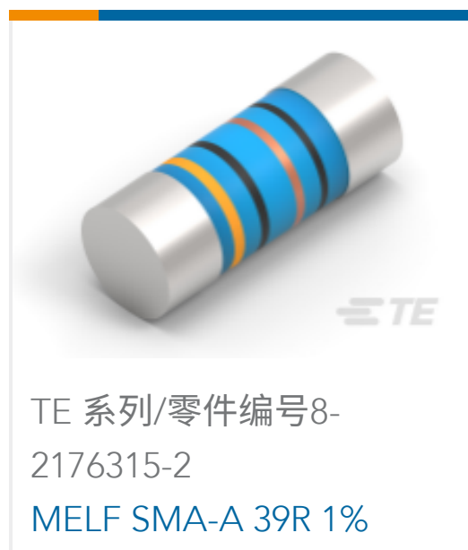
TE 系列/零件编号8- 2176315-2 MELF SMA-A 39R 1% 50PPM 0204 0.4W