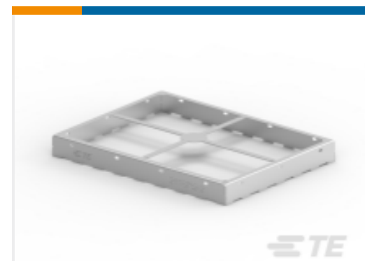
TE 系列/零件编号 2118732-2 STD SHIELD FRAME, CRS-50.80X38.10X5.08MM