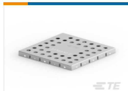
TE 系列/零件编号 2118717-2 STD SHIELD COVER, CRS-26.71X26.71X2.00MM