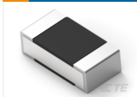
TE 系列/零件编号 3-2176305-6 RP 1E 0.1W 249R 0.1% 25PPM 5K RL