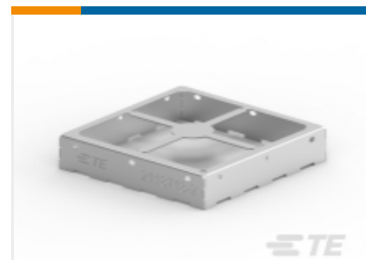
TE 系列/零件编号 2118718-2 STD SHIELD FRAME, CRS-26.21X26.21X5.08MM