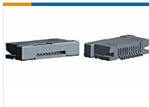
TE 系列/零件编号 1734592-6 FPC CONN. 0.5MM PITCH B/C, 6P