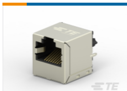
TE 系列/零件编号 5-2301995-2 RJ45 JACK INT.MAG. 10/100 1X1 VERT.