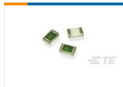
TE 系列/零件编号 4-2176089-5 RP 1J 0.166W 32K4 0.1% 25PPM 1K RL