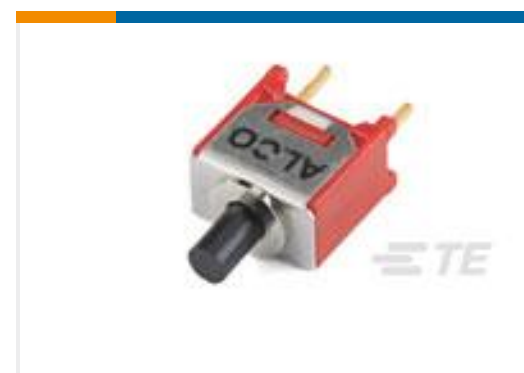
TE 系列/零件编号 2267130-1 SUBMIN PUSHBUTTON, PBS8MTRES