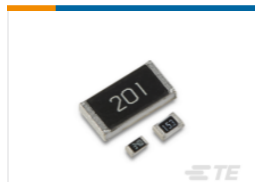
TE 系列/零件编号 2176326-6 CRGP 0603 27R 1%