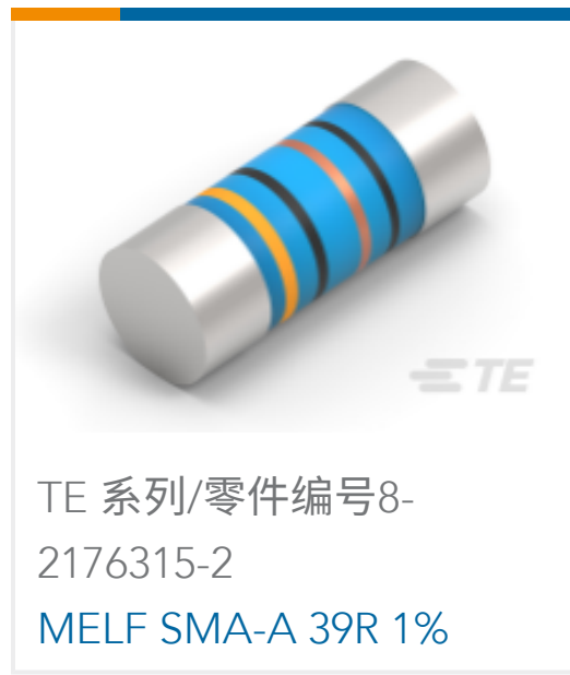
TE 系列/零件编号8- 2176315-2 MELF SMA-A 39R 1% 50PPM 0204 0.4W