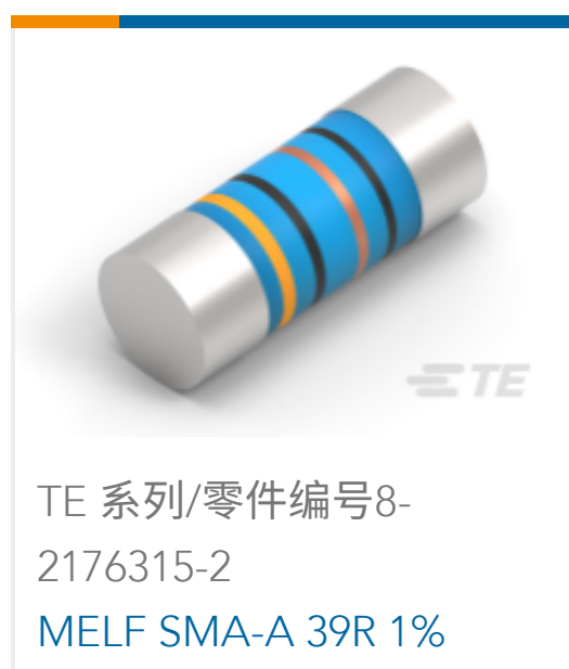
TE 系列/零件编号8- 2176315-2 MELF SMA-A 39R 1% 50PPM 0204 0.4W